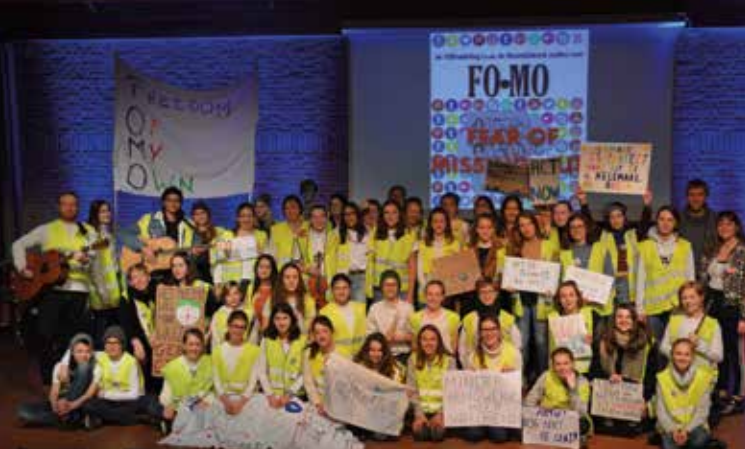
Wie van poëzie en toneel houdt, kan in onze poëziegroep "De Versafdeling" terecht. Wie graag zingt en muziek speelt, kan aansluiten in onze "Muziekfabriek".