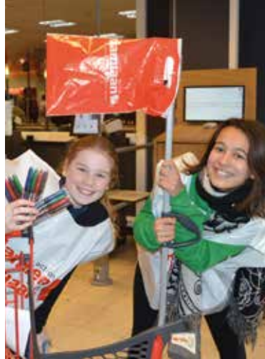
Samen met je vrienden op stap gaan om je in te zetten voor het goede doel is een heel leuke ervaring.