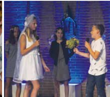
Een hoogtepunt voor elke leerling van het eerste jaar: de ontgroening. Zo hoor je er pas echt bij. Je krijgt dan ook een meter of een peter.