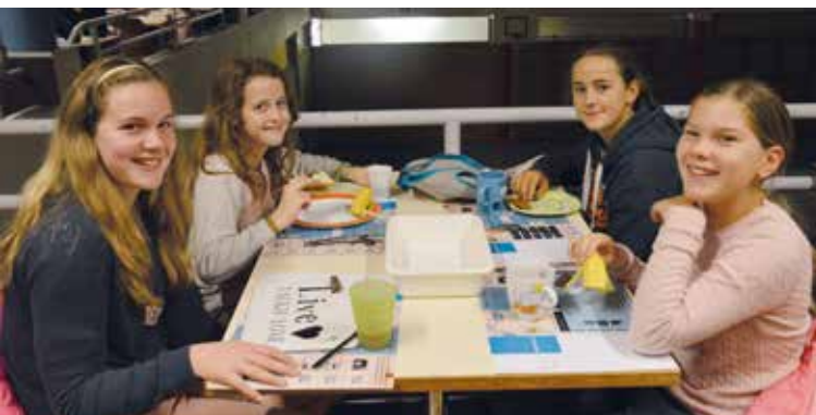
Met je deelname aan het jaarlijkse wereldwinkelontbijt steun je ons Plan-kind. Het ene schooljaar is er een cultuurdag, het andere schooljaar een mondiale dag, boordevol interessante workshops en leuke activiteiten.