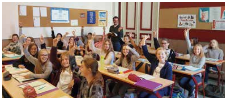
Deze folder bevat heel wat foto's uit de periode vóór de coronamaatregelen.