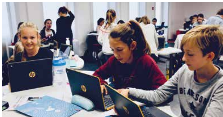
Het gebruik van de computer en andere media biedt voor heel wat lessen een andere aanpak. Je leert zelfstandiger werken.