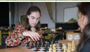
In de "Chessmates" kan je je vrienden uitdagen voor een spelletje schaak.