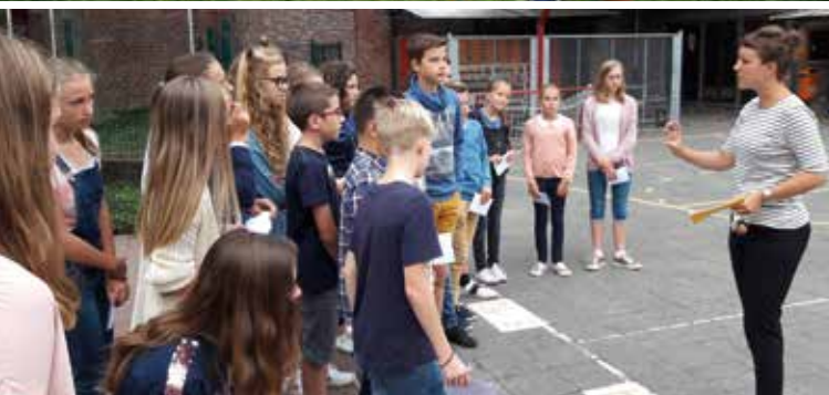
De tweede schooldag verken je de school onder leiding van je klassenleraar.