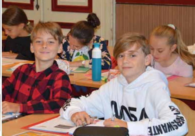
Bij ons moet je ook studeren. We helpen je hier op weg. Je leert leren ...