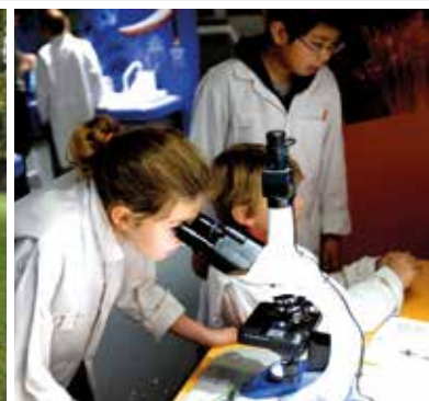
Tijdens excursies wordt de theorie aan de praktijk getoetst.