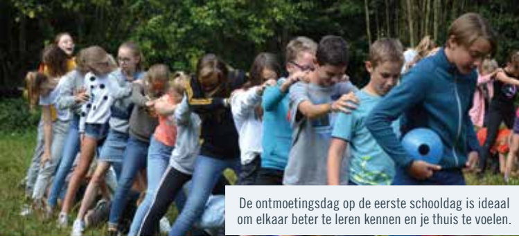
De ontmoetingsdag op de eerste schooldag is ideaal om elkaar beter te leren kennen en je thuis te voelen.