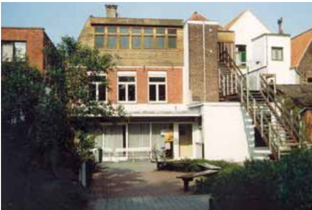
De achterkant van het D-gebouw met de aangebouwde trap en opgetrokken verdieping