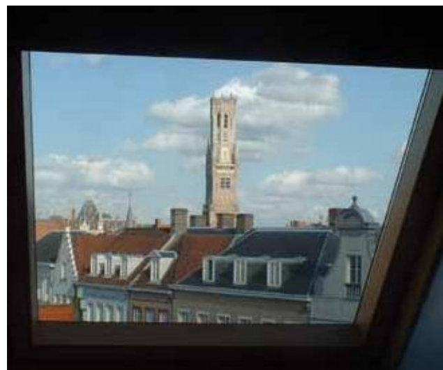
Zicht op het belfort vanuit een dakraam in het A-gebouw

De school liet in 1998 de vrijgekomen ruimte verbouwen tot drie klaslokalen en een stille ruimte. Tijdens deze werken legde de bouw-firma het oorspronkelijke dakgebinte bloot dat een extra cachet geeft aan deze verdieping.