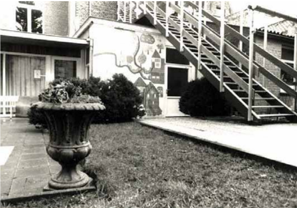
Het gerenoveerde D-gebouw versus het oude.