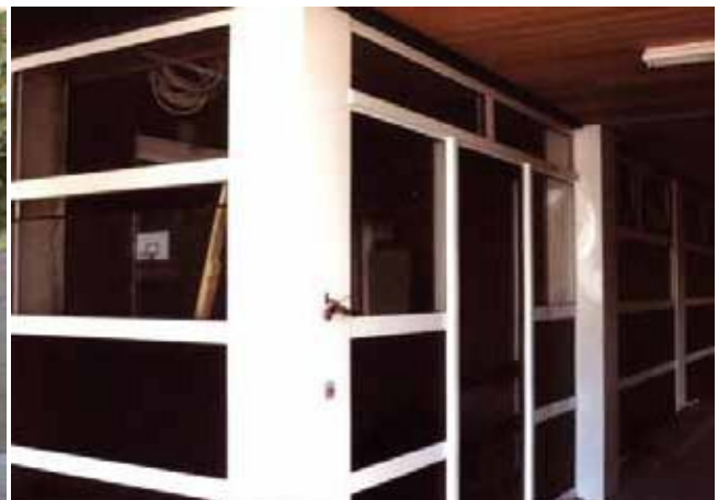
Het nieuwe biologielokaal