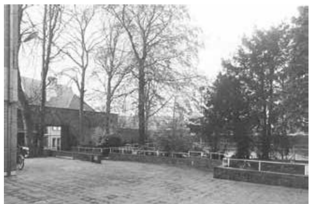
De speelplaats voor de herschikking: zonder de muurtjes en het niveauverschil zou er veel meer plaats zijn.

In deze periode bouwden vaklui naast het C-gebouw twee preparatielokalen en drie nieuwe lokalen met ondermeer een biologie-