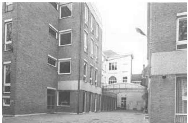
Van links naar rechts: B-, A- (in het wit geverfd) en C-gebouw van op de speelplaats bekeken

Vanaf het schooljaar 1975-1976 behoorden de twee woningen van de Wulfhagestraat officieel tot het Sint-Jozefsinstituut en kregen de logische naam “D-gebouw”. De lerarenkamer verhuisde naar deze nieuwe locatie (voordien had het huidige kantoor van de adjunct-directeur deze functie). De school bracht er de drukkerij onder, net