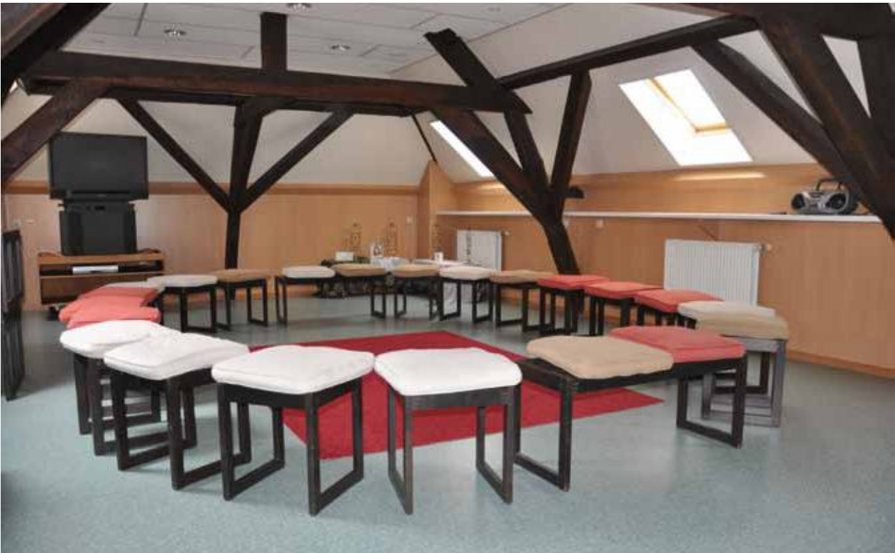
De stille ruimte

lokaal. Noodgedwongen braken zij de oude bioklas vroeger af, omdat de plannen meer dan vijf jaar oud waren en de school anders een nieuwe bouwaanvraag moest indienen. Om de leerlingen tijdens deze bouwavonturen zonder kleerscheuren en gebroken botten naar hun klassen te loodsen besloot de directie de rijen af te schaffen. Sindsdien trekken leerlingen bij het eerste belsignaal met min of meer enthousiaste tred klaswaarts. Voor het E-gebouw handhaafde de directie de oude gewoonten.