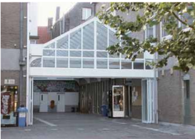
De glazen overkapping